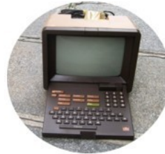
Disparition du besoin : le minitel en 2012