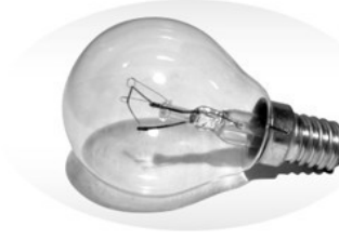
Changement de norme : interdiction des ampoules à incandescence en 2009