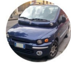
La fiat Multipla a rapidement été remplacée par un modèle plus performant économiquement

On appelle cycle de vie économique d'un objet l'évolution de ses ventes dans le temps. Ce cycle de vie suit généralement quatre phases : le lancement (mise sur le marché), la croissance , la maturité et le déclin . La fin de vie du produit est liée soit à la disparition du besoin , soit au changement de norme , soit au remplacement par un produit plus performant techniquement et économiquement .